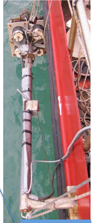
Supporto palo trasduttori sbp, multibeam