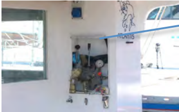
Distributore centralina idraulica